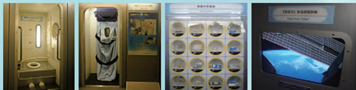
宇宙トイレ 宇宙ベッド 4ヶ国の宇宙食 「きぼう」からの眺め

日本が独自で開発した宇宙実験棟「きぼう」。この「きぼう」をイメージした空間の中で、宇宙でのトイレやベッド、4ヶ国の宇宙食等、宇宙での「衣・食・住」をご覧いただけます。