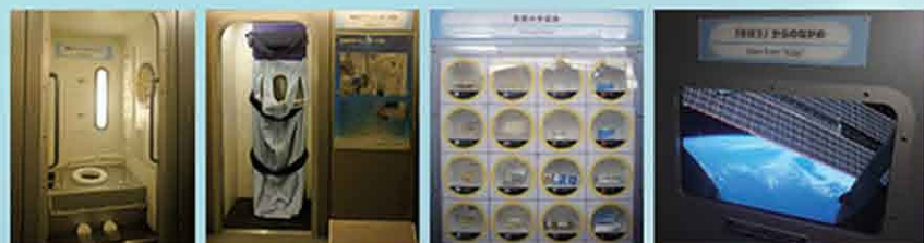
宇宙トイレ 宇宙ベッド 4ヶ国の宇宙食 「きぼう」からの眺め

日本が独自で開発した宇宙実験棟「きぼう」。 この「きぼう」をイメージした空間の中で、宇宙 でのトイレやベッド、4ヶ国の宇宙食等、宇宙で の「衣・食・住」をご覧いただけます。