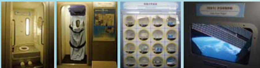
宇宙トイレ 宇宙ベット 4ヶ国の宇宙食 「きぼう」からの眺め